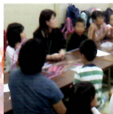
大津夜まわりの会 2020夏休み子どもひま わりの家事業