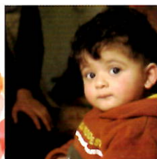
日本国際ボランティア センター パレスチナ・子どもの 栄養失調予防改善事業

本イベントは「大津・SDGsくるくる チャリティプロジェクト2019」の一事業 です。事業収益は貧困世帯の子どもを 支援する以下の2団体に寄付されます。 本事業については、大津市市民活動センター のHPまたはFACEBOOKをご覧ください